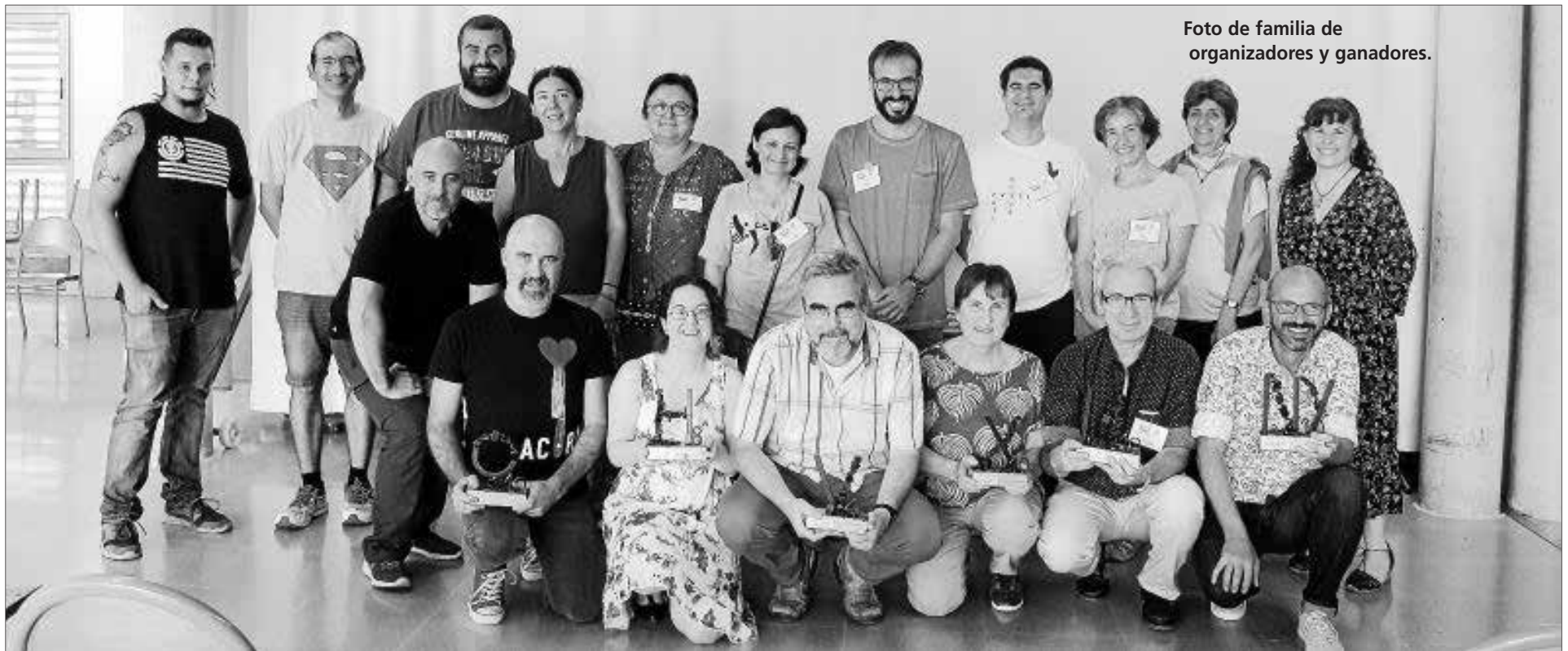
Foto de familia de organizadores y ganadores.