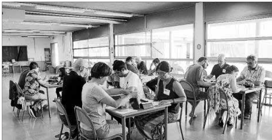
La concentración es muy importante en este juego.