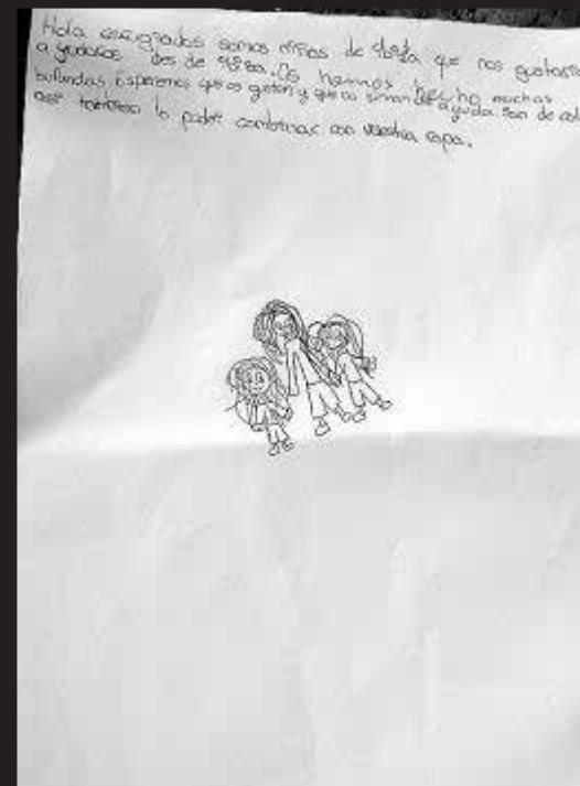
Corazón solidario. Los alumnos se han volcado gratamente con esta actividad y hasta han escrito cartas para acompañar el material del envío.