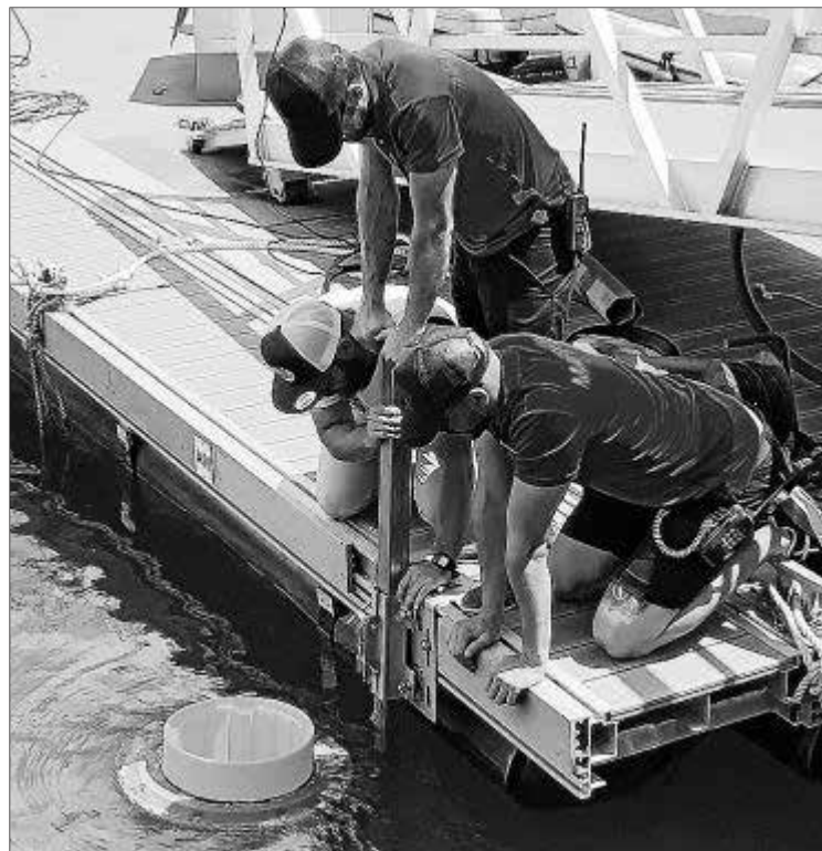
La iniciativa también recopila datos para su posterior estudio.

El proyecto medioambiental Seabin consiste en la instalación de bidones en el agua en diferentes puntos estratégicos. La función del recolector de basura V5 Hybrid es la de absorber los residuos flotantes gracias al funcionamiento de unas bombas mecánicas que hacen circular el agua creando una corriente marina. Además, esta iniciativa tiene también un objetivo científico ya que semanalmente se recopilan datos sobre el material de desecho recogido para posteriores estudios e investigaciones sobre micro-plásticos llevados a cabo por científicos e instituciones