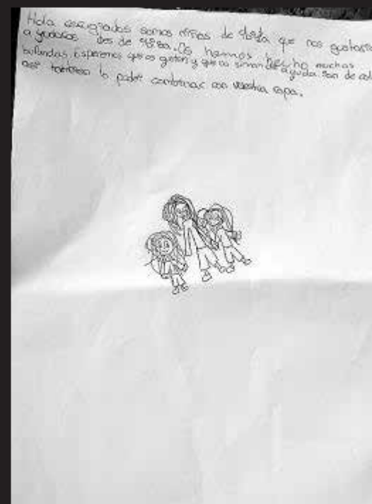
Corazón solidario. Los alumnos se han volcado gratamente con esta actividad y hasta han escrito cartas para acompañar el material del envío.