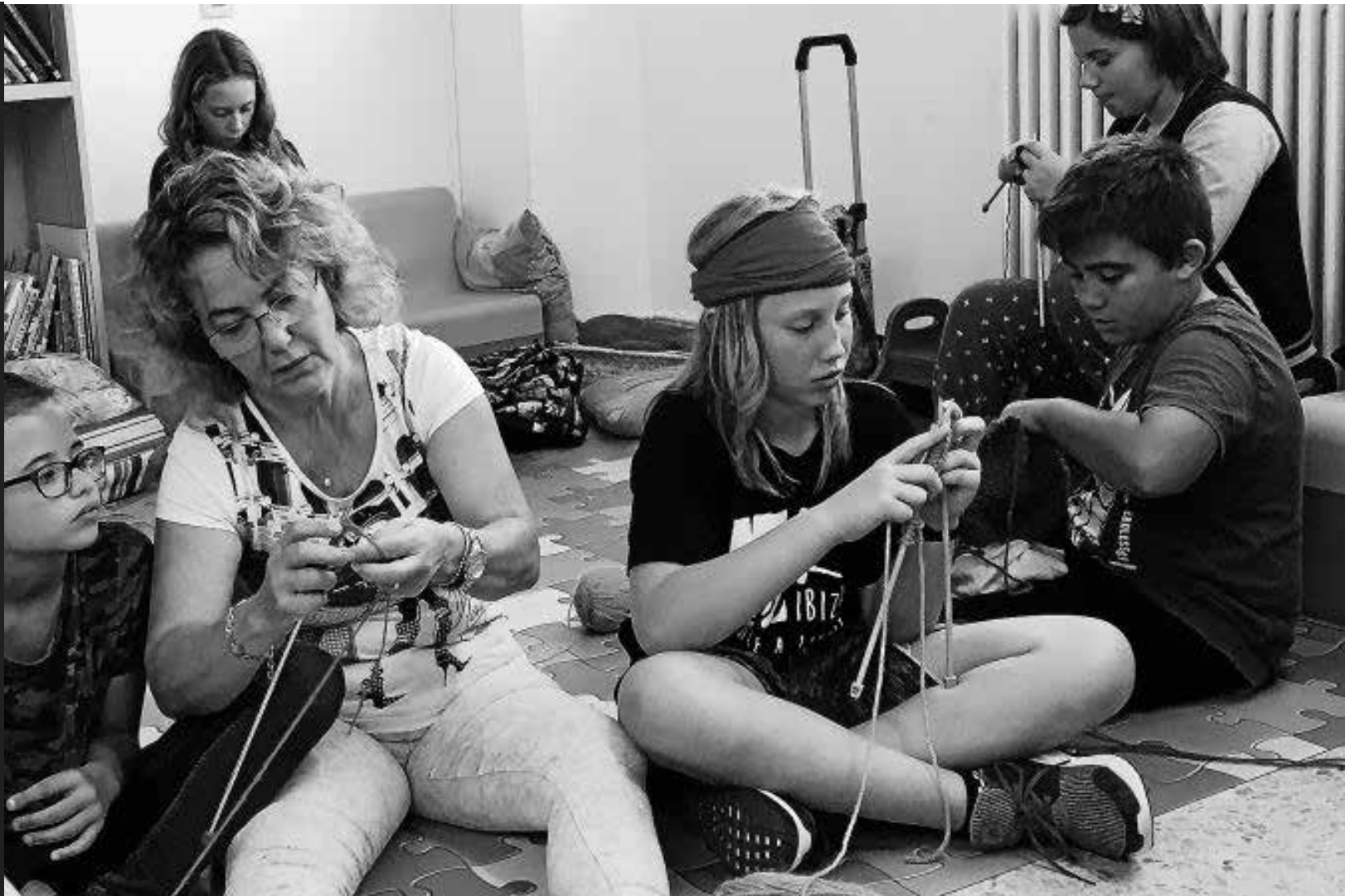
Los alumnos durante uno de los talleres donde aprenden a tejer.

A lo largo del curso alumnos del tercer ciclo de primaria han realizado el taller 'Yarn Bombing Solidario', a través del cual han tejido gorros y bufandas para los refugiados