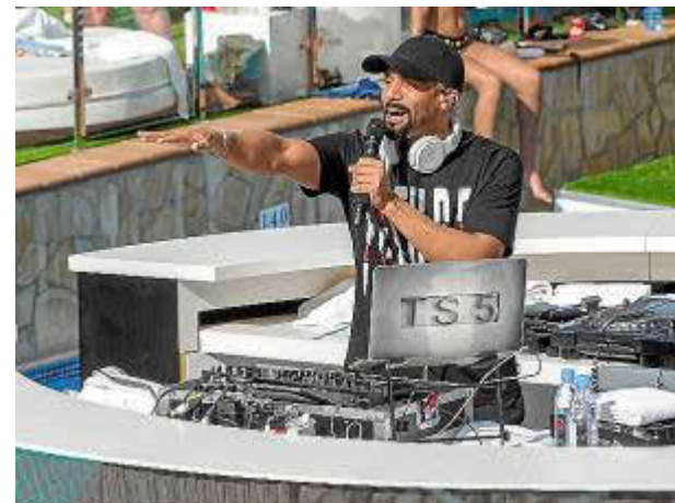
Imagen de Craig David durante su performance en Ibiza Rocks, TS5 Pool Party.