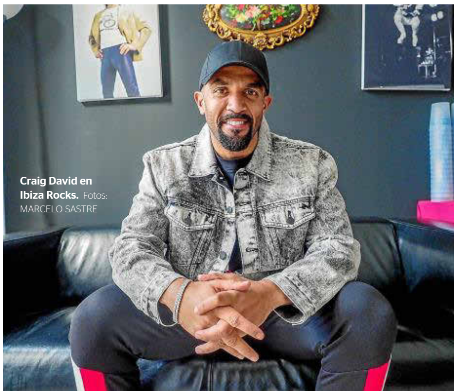
Craig David en Ibiza Rocks.

—La verdad que sí. Hacer feliz a los demás es de lo que se trata la música. No necesitas poner dinero ni tener una buena charla, solo se trata de hacer que la gente tenga buenas sensaciones y quiero llegar a