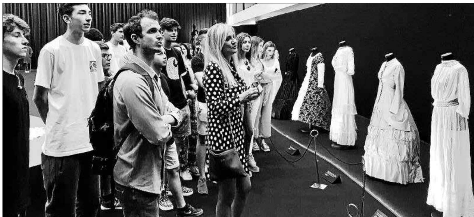
Imagen de la visita de los alumnos de Formación Profesional de IES Sa Blanca Dona ala exposición 'Vísteme: de la Alta Costura al Arte'.