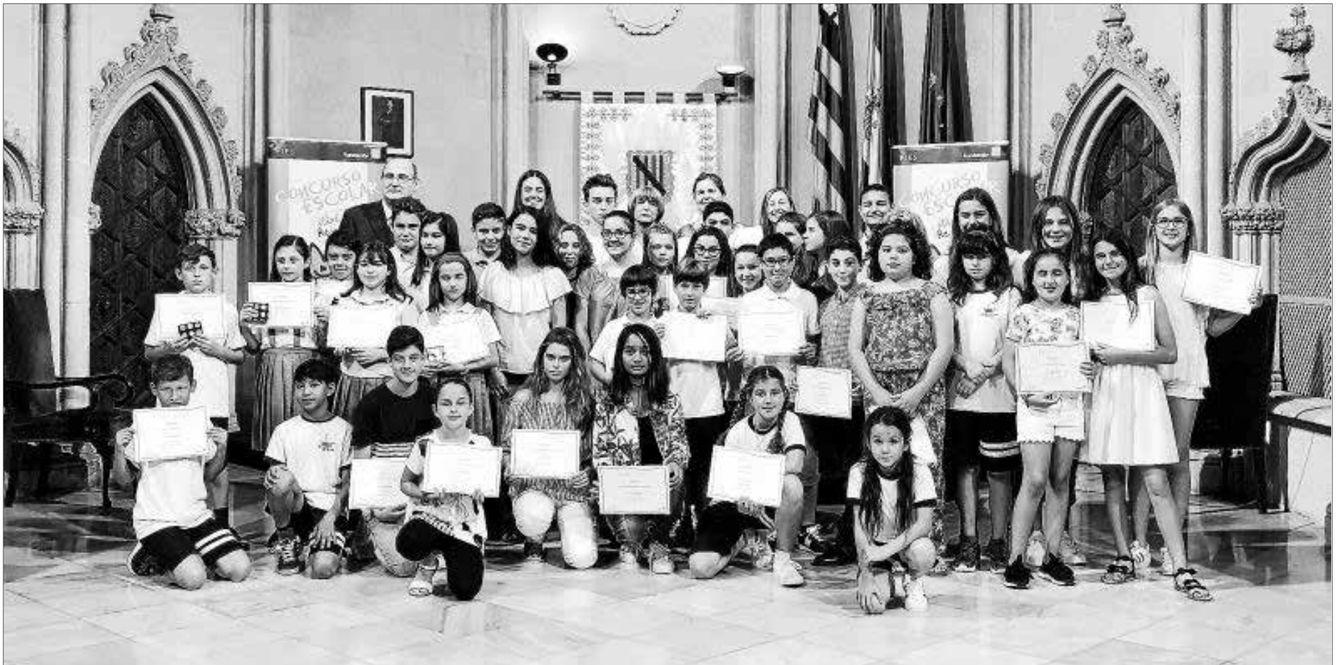
Imagen de los ganadores junto a los organizadores el viernes por la mañana en Palma.