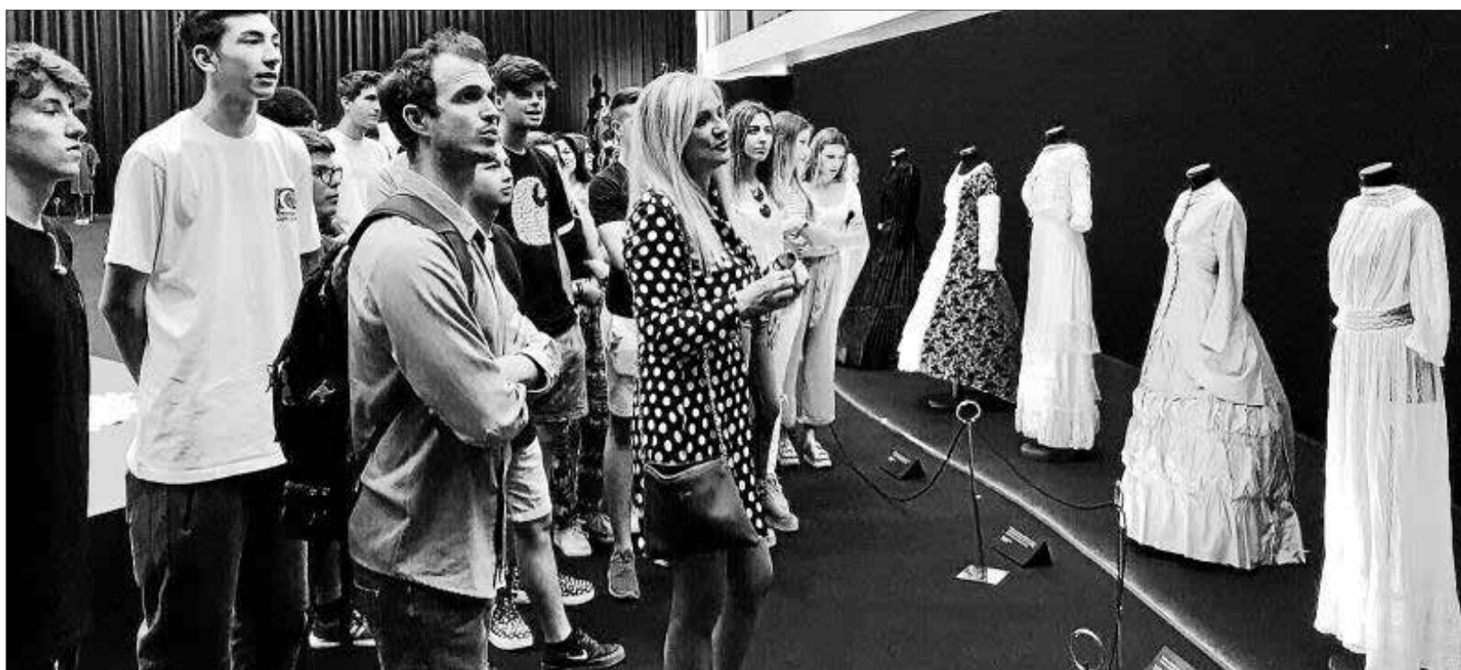
Imagen de la visita de los alumnos de Formación Profesional de IES Sa Blanca Dona ala exposición 'Vísteme: de la Alta Costura al Arte'.