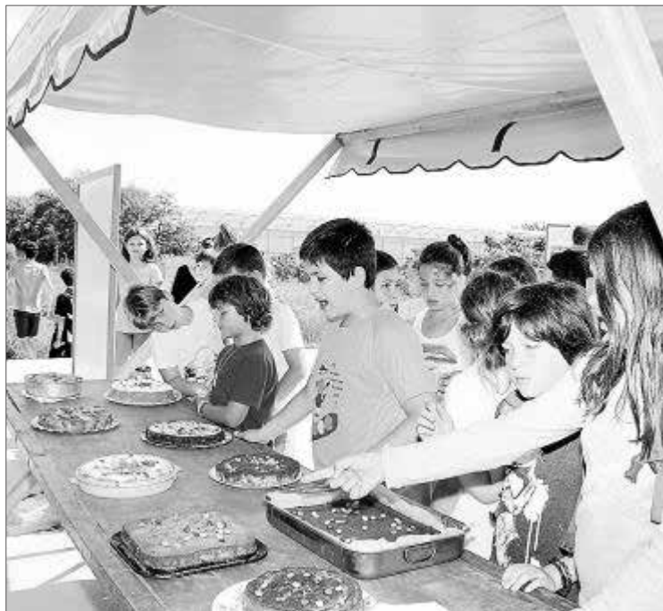
Los niños degustaron recetas con productos de la tierra.

Este proyecto que ha implicado a 10 colegios de la isla entre los que se encuentran el Vènda d'Arabí, Puig d'en Valls, S'Olivera, Nostra Senyora de Jesús, Santa Eulària, Santa Gertrudis, Sant Carles, Sant Ciriac, Xarc y Quartó des Rei, además, diversas fincas han apadrinado a estos colegios en sus proyectos