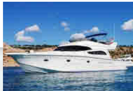
Rodman Polyships Rodman 56 17m | 2003 230.000 € IVA incluido

Agente para yates y buques en Ibiza desde 1979