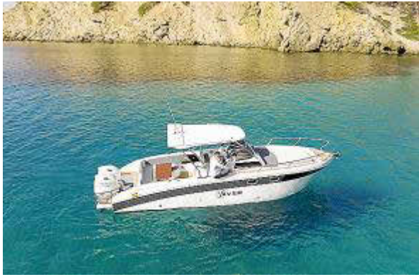
Saver 870 WA tiene capacidad para hasta 10 personas.