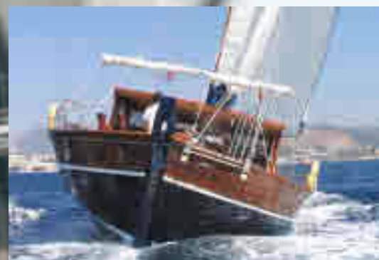
Bodrum Tirandil 20m | 2000 399.000 € IVA incluido