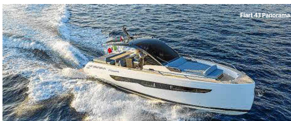
Fiart 43 Panorama.

Sealine S390 Elegancia y funcionalidad en armonía El Sealine S390 es una declaración de elegancia y funcionalidad. Con su diseño moderno y líneas limpias, este yate ofrece un ambiente acogedor y cómodo para todos a bordo. Desde su amplio salón hasta sus lujosas cabinas, el S390 está diseñado para impresionar en todos los sentidos.