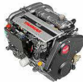
El motor 4JH-CR se adapta a una amplia variedad de tamaños de embarcaciones y aplicaciones.

Este barco, de casi 7 metros de eslora, es la mejor manera de llegar a los lugares más recónditos de la isla. Dispone de mucho espacio abierto para disfrutar del sol y existe la op-