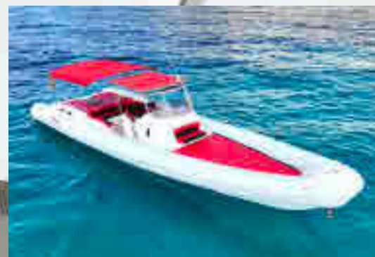
SACS Stratos 42 12m | 2008 105.000 € IVA incluido