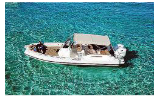
La Clubman 28 cuenta con una distribución excepcional.

ción de una tumbona doble: una fija en proa y otra convertible en popa, aprovechando el comedor y la mesa. La cabina dispone de cama doble, ojos de buque y puede equiparse con un WC químico o eléctrico, aunque no en un compartimento independiente.