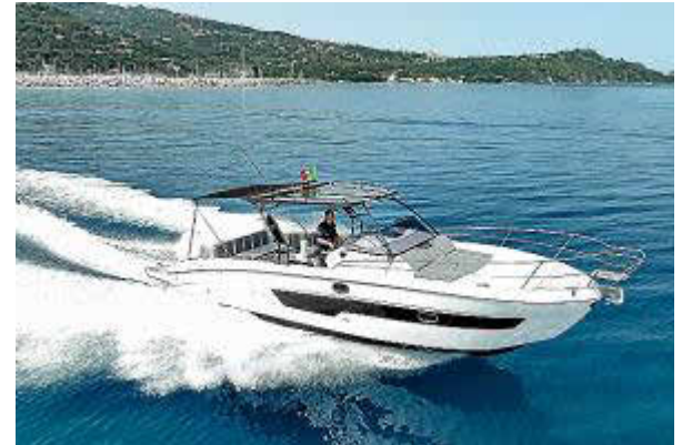
Disfruta de amplios espacios exteriores en la Saver 330 WA.