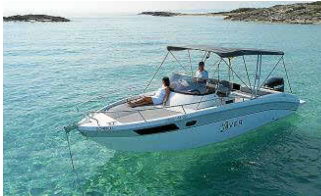
La gran bañera polivalente es lo que más sorprende de la Saver 750 WA.