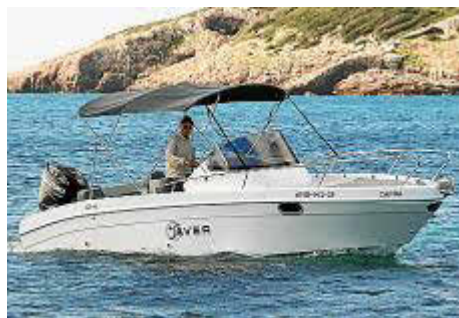
Saver 660 WA, de casi 7 m de eslora.

La embarcación Saver 750 WA ofrece líneas suaves y envolventes. Impresiona con un diseño atemporal y agradable, que desta-