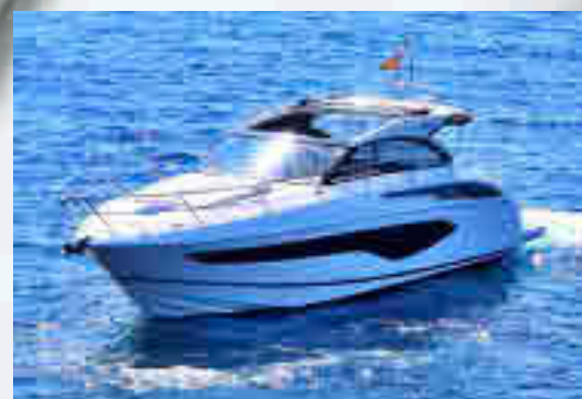
Princess V50 15m | 2018 850.000 € IVA incluido

Marina Botafoch • Paseo de Juan Carlos I, s/n • Local 108 B • 07800 Ibiza Tel. +34 971 316 521 • Fax: +34 971 316 752 • www.navegarteibiza.com